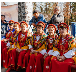
Схема малых грантов